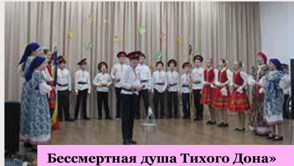
«Бессмертная душа Тихого Дона»