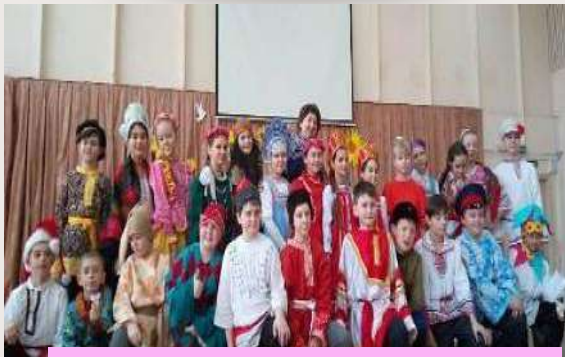
Широкая масленица в школе №15