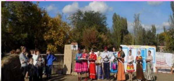
Конкурс «Донская красавица»