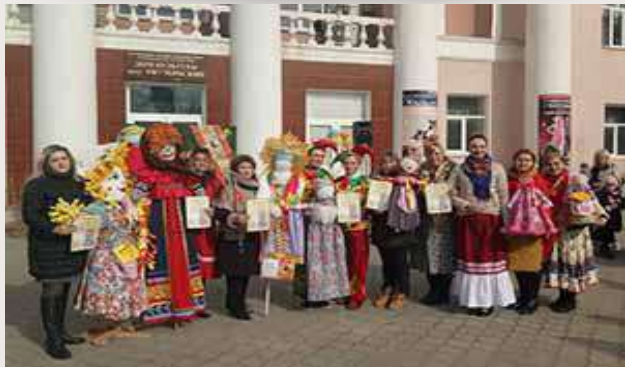
Широкая масленица в станице Ново-Баклановской