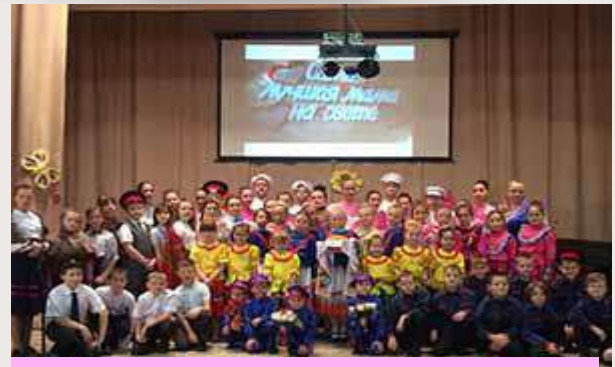
День матери-казачки ДШИ мкр. Донской