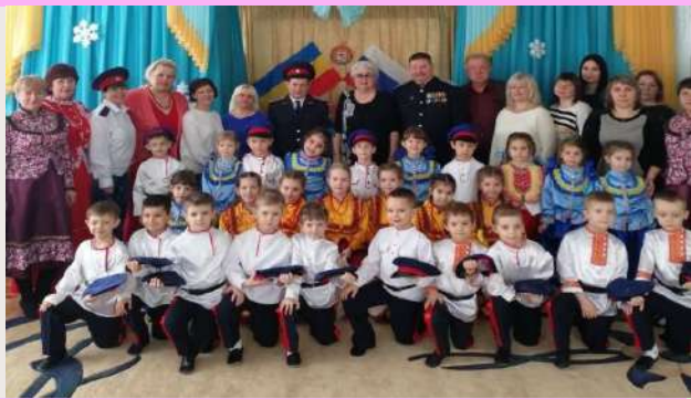
После проведения «Казачьего круга»