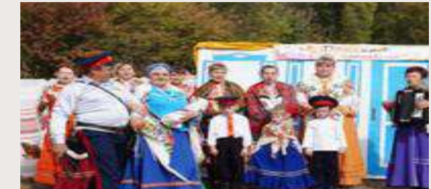
Покров в МБУ ДО Эколого-биологическом центре