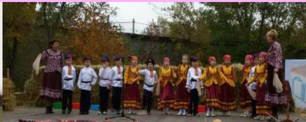
Фестиваль-праздник казачьего фольклора «Как у нас на Дону»