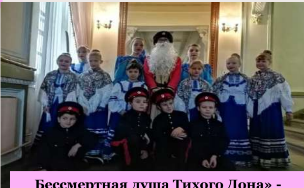
«Бессмертная душа Тихого Дона» - участники школы №2